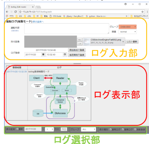
Figure 2: 編集モード画面

また、過去に入力した内容を変更する場合には、ログリスト内の登録日付時刻へのリンクをクリックする。変更用ダイアログがポップアップ表示されるので、そこで編集作業や項目の削除を行うことが出来る。