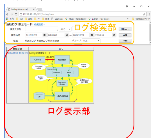
Figure 3: 閲覧モード画面

閲覧モードでは時間降順に表示するため主として表示後に紙媒体に印刷し・保存する用途に適している。