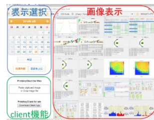
Figure 5: 画像ログシステム Web 画面

この Web 画面には画像登録の Client 機能がついている。クリップボードに画像をコピーしたのちに”Paste clipboard image or Drop image file”の部分で”貼り付け”をするか、画像ファイルをドラッグ&ドロップすると登録確認ダイアログが表示される。ダイアログ上でキャプションを入力し、登録ボタンを押下すると、画像が登録される。また、同等の機能を持つ Windows 版の Client プログラムも作成してあるので、ダウンロードして使用することも可能となっている。Fig.5 に実行例を示す。